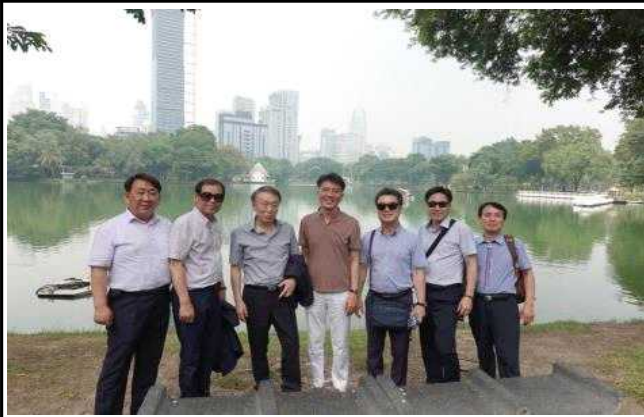
공원내 인공호 2