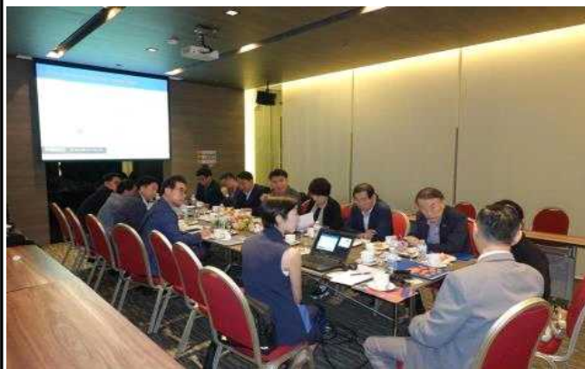
IMPACT 전시관 소개