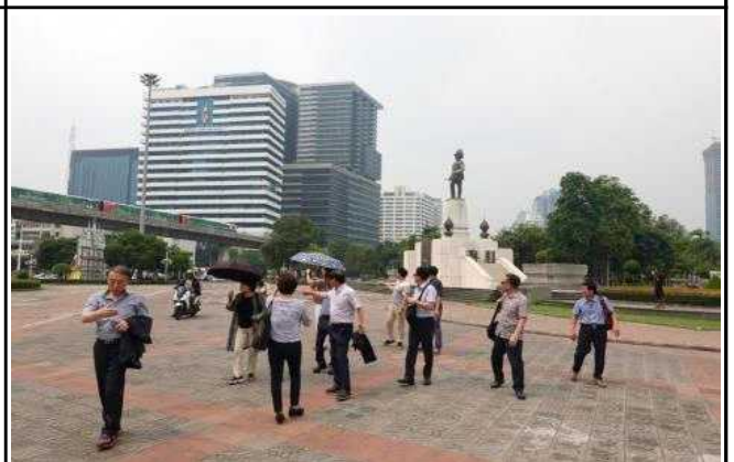
공원인근을 지나는 지상철