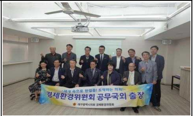
타이페이 상협회 기념촬영