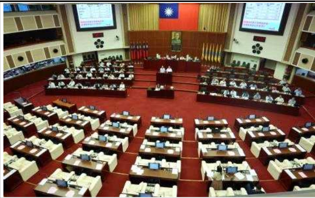
시의회 참관(교통분야 상임위 질의 중)