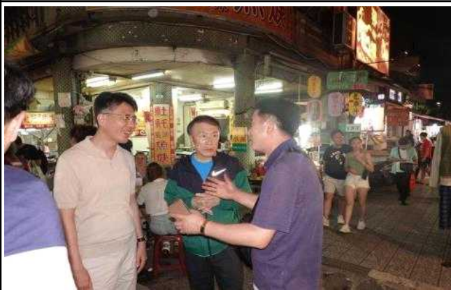
야시장 관련 토론