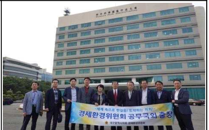
신추사이언스파크 방문 기념촬영2