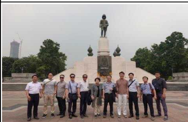
라마6세 기념 동상