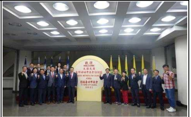
타이페이 시의회 기념촬영 2