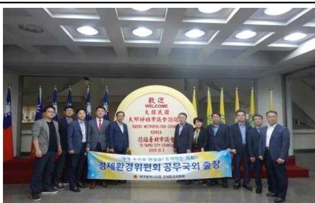
타이페이 시의회 기념촬영