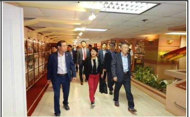
타이페이 시의회 기념관 관람