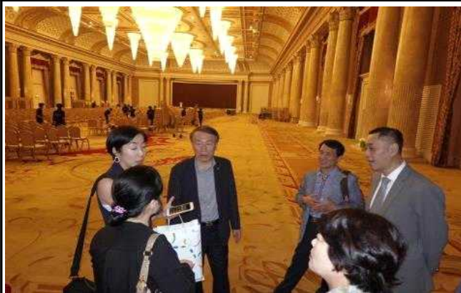
전시장 시설 견학