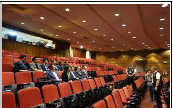
타이페이 시의회 소개