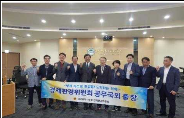
신추사이언스파크 방문 기념촬영