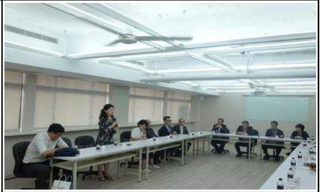
타이페이 상협회 숙박업 대표 인사말씀