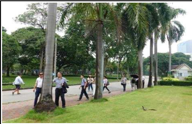
룸피니 공원 입구