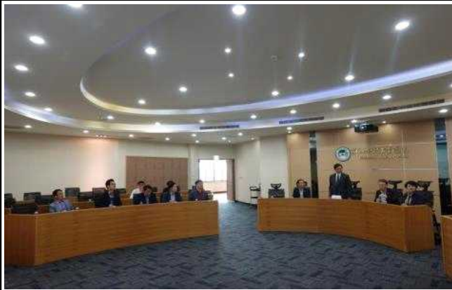
신추사이언스파크 원장 인사말씀