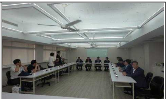
타이페이 상업회 소개