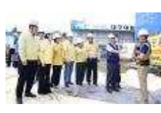
캠프워커 동편 반환부지