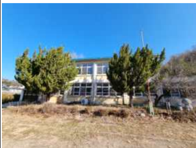
교사동 건물 전경