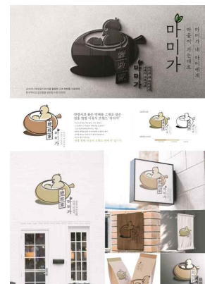
〈옥외광고 대상전 - 대상〉