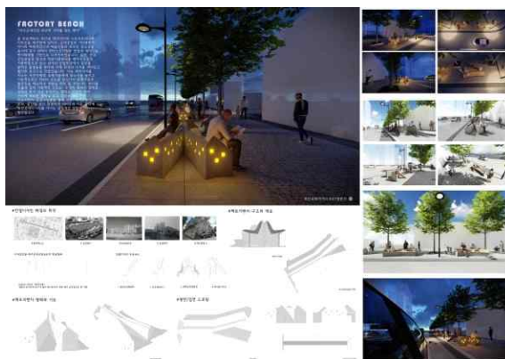
〈공공디자인 공모전 - 대상〉