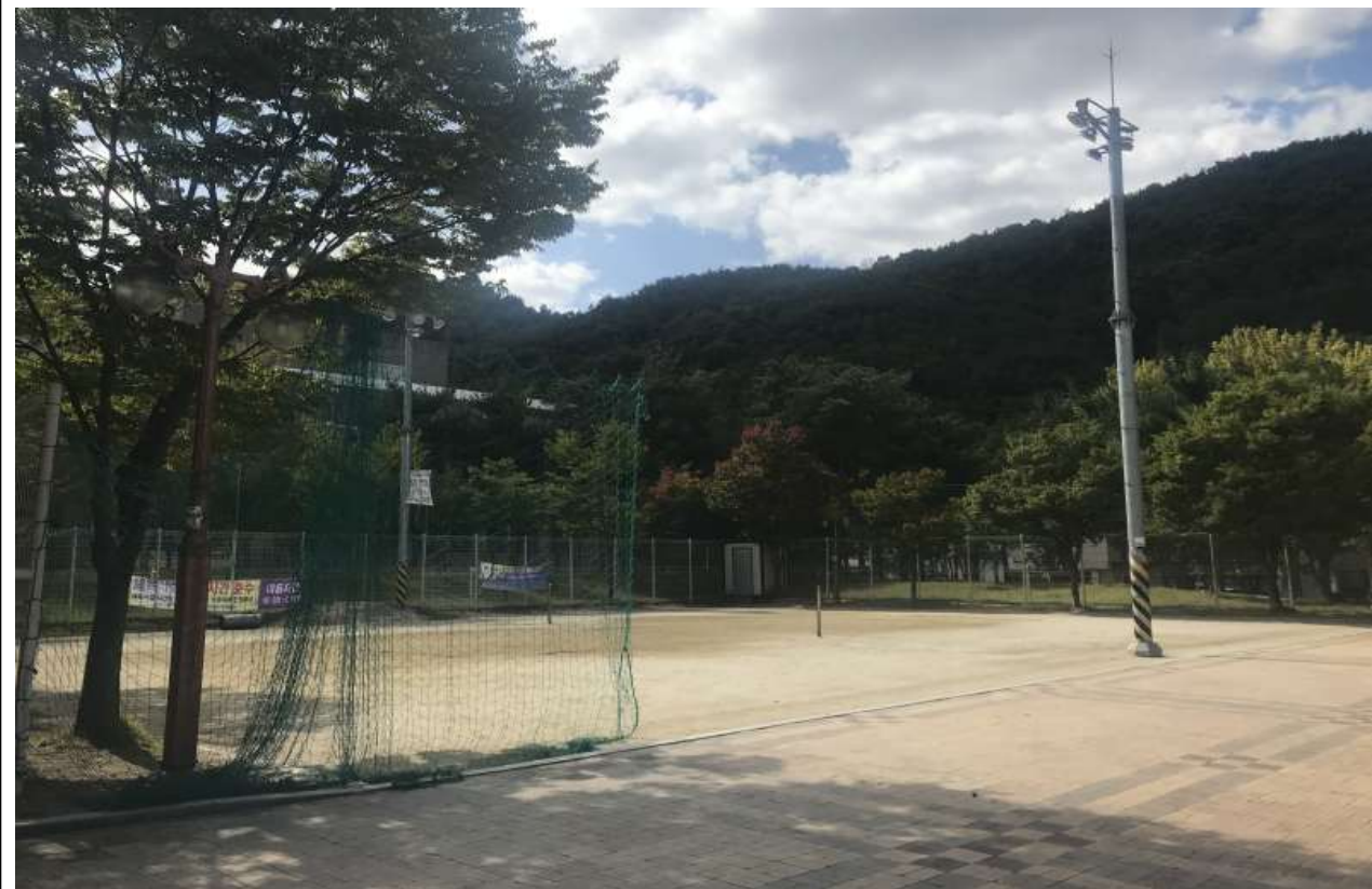
현 장 전 경